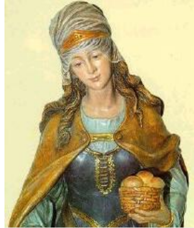
Heilige Elisabeth von Thüringen

Als Sinnbild tätiger Nächstenliebe wird Sie in der evangelischen Kirche verehrt.