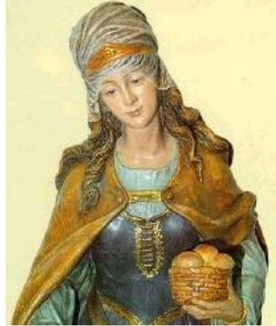
Heilige Elisabeth von Thüringen

Als Sinnbild tätiger Nächstenliebe wird Sie in der evangelischen Kirche verehrt.